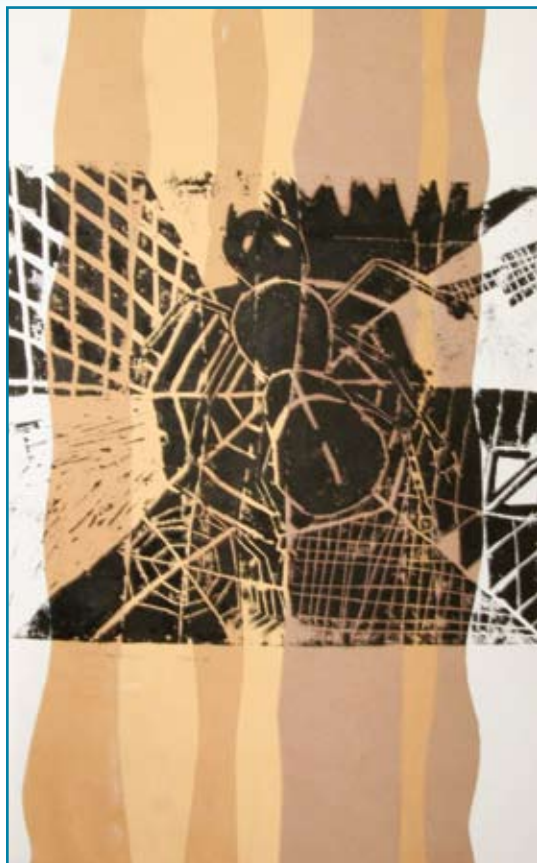
Júlia Laubertová, 10 rokov, ZŠ Golianova, Banská Bystrica Pavučina 2