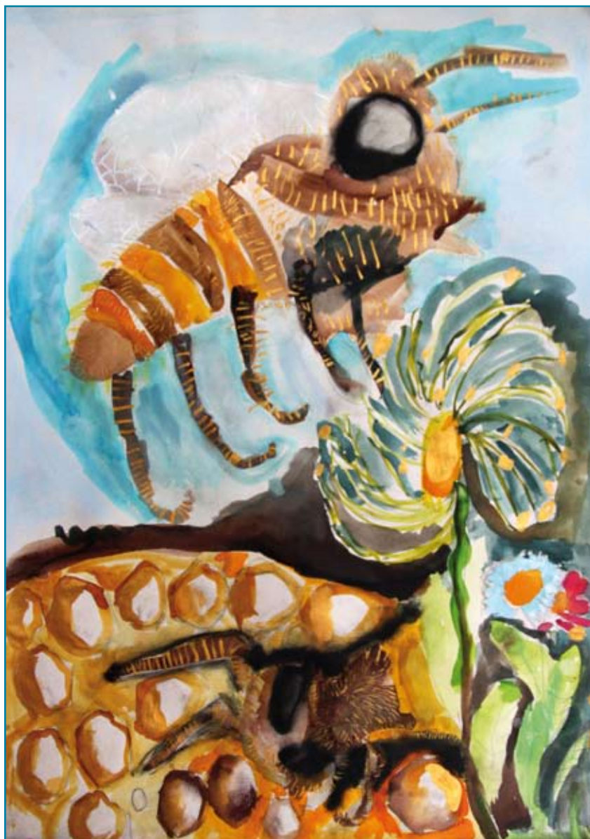
Adéla Kvitová, 6 rokov, ZUŠ Nový Jičín Život včelky