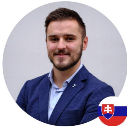
Expansion Manager & Country Manager - Slovensko