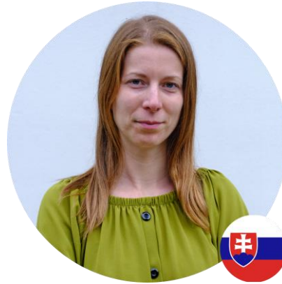
Consulting Team Leader - Slovensko

Rozvoj Cyrkl na Slovensku a mezinárodná expanzia roman.gdovjak@cyrkl.com